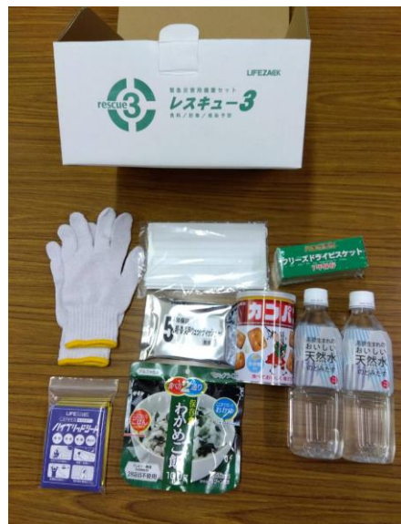
緊急災害用備蓄セット